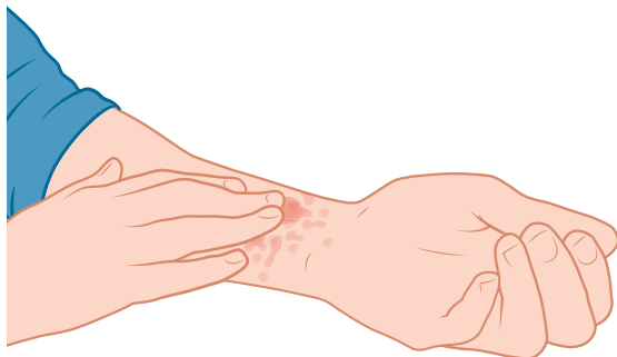
jeuk rode vlekken of bultjes