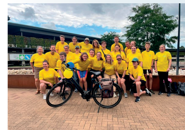
Aankomst bij ziekenhuis in Ede, Shared Care centrum voor behandeling van kinderen met kanker.

De tocht genereert niet alleen veel landelijke aandacht, er is ook 30.000 euro opgehaald voor de Kanjerketting, een initiatief van de Vereniging Kinderkanker Nederland. De Kanjerketting helpt kinderen met kanker. Na elke zware behandeling of onderzoek wordt aan de ketting een nieuwe kraal toegevoegd. Zo heeft elk kind een unieke ketting dat zijn of haar eigen verhaal vertelt.